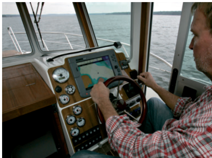
Ohjaamossa on erinomainen paikka plotterille. Liukuovien kanssa pitää olla varovainen, etteivät sormet jää oven väliin.