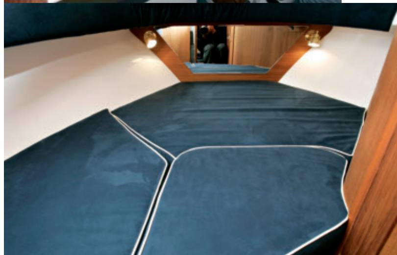
nen on vaivatonta. Lienee siis itsestään selvää, että yhteysveneinä Nord Starit ovat erinomaisia.