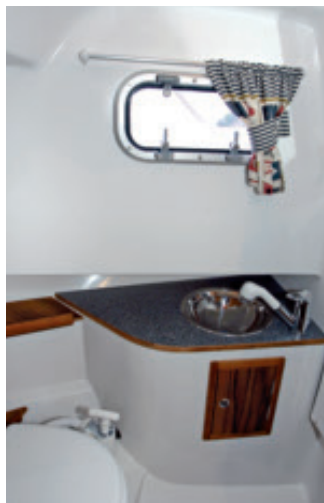
Vessa on pelkistetyn asiallinen.