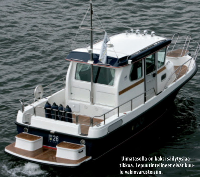
Uimatasolla on kaksi säilytyslaatikkoa. Lepuutintelineet eivät kuulu vakiovarusteisiin.