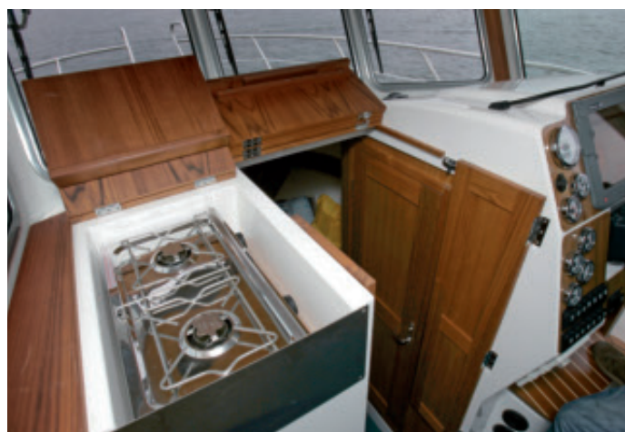
Keitin on sijoitettu karttatason alle.